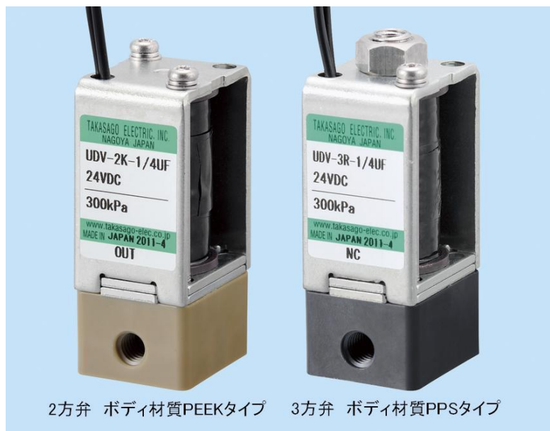
2方弁 ボディ材質PEEKタイプ 3方弁 ボディ材質PPSタイプ